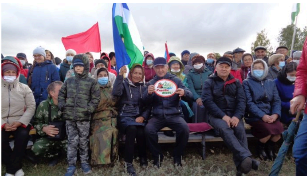
Участники народного схода в селе Аскарково, 20 сентября 2020 года

схода в защиту Кыркытау, в них участвовало до двух тысяч человек. На второй митинг пришли не только местные, но и жители других районов Башкортостана. Люди скандировали «Кыркты-тау йәшә!» . Местные СМИ писали , что полиция пыталась задержать активиста с флагом в поддержку Куштау, но быстро отпустила .