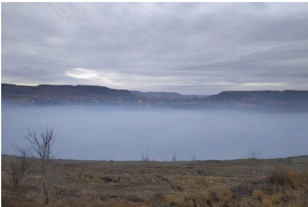
Дым от горения серы в сибайском карьере, ноябрь 2018 года