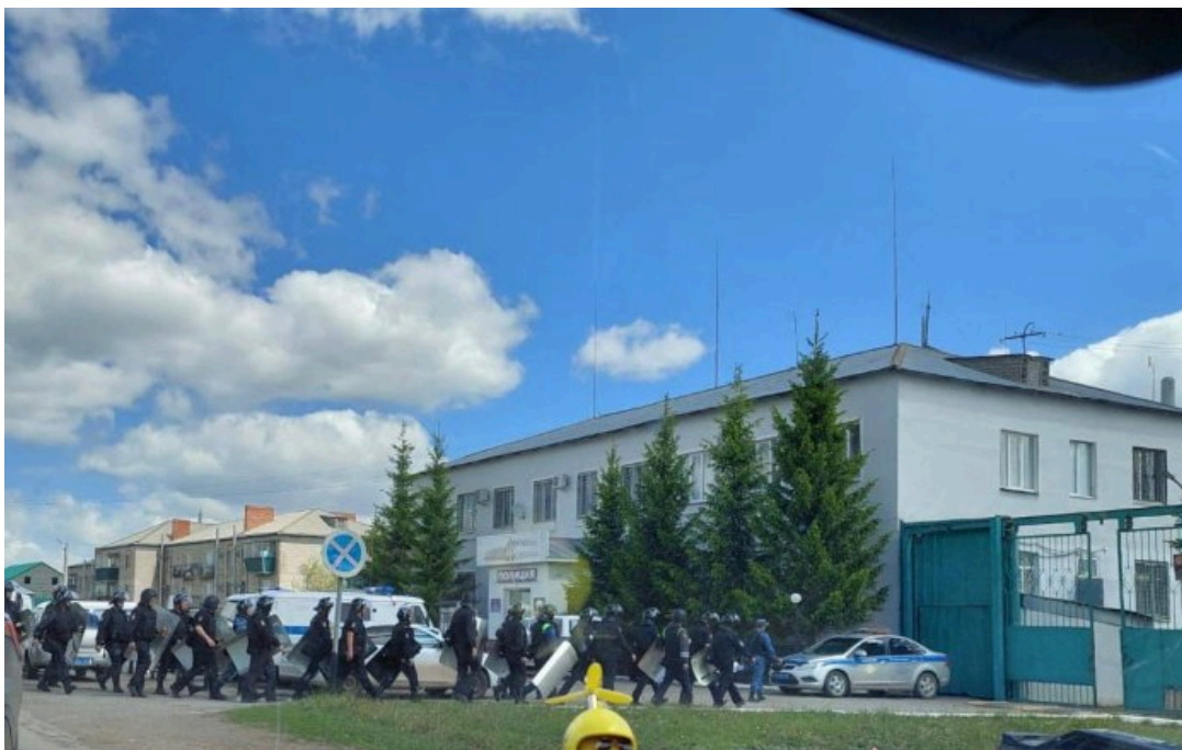
Силовики в селе Аскарново, 22 мая 2025 года