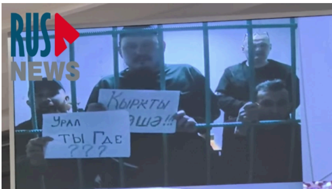
Фигуранты «баймакского дела» проводят пикет в защиту Крыктытау по видеосвязи во время заседания Верховного Суда, 3 июня 2025 года

«Трудно переломить сознание, ведь [район] Абзелил впервые примеряет на себя роль возможной крупной промышленной площадки и как все новое, оно пугает. <...> Я надеюсь, что мы все, члены наблюдательного совета, сумеем проследить, чтобы все обещания и заверения компании были выполнены», — добавляет она.