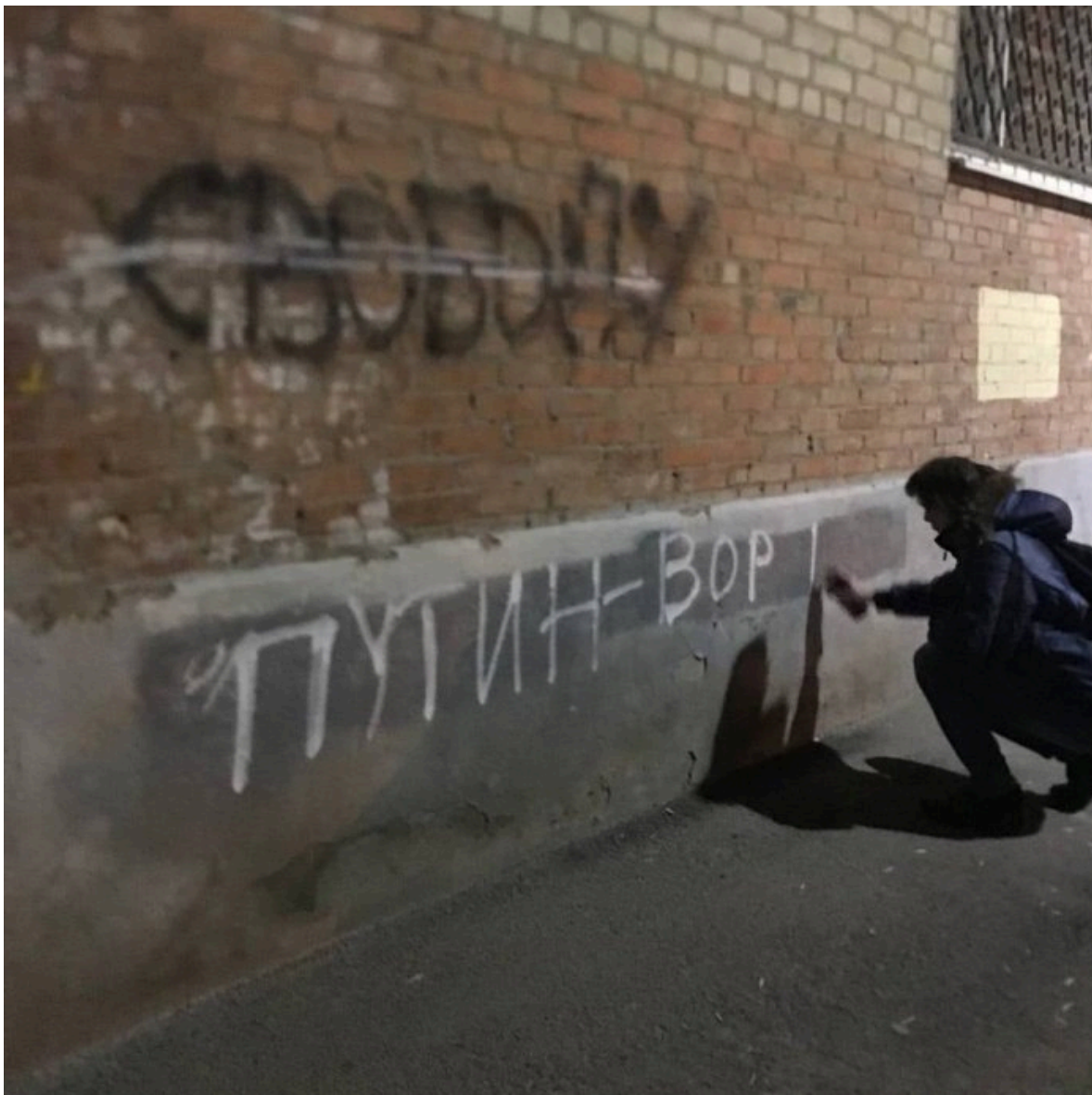
Фото граффити